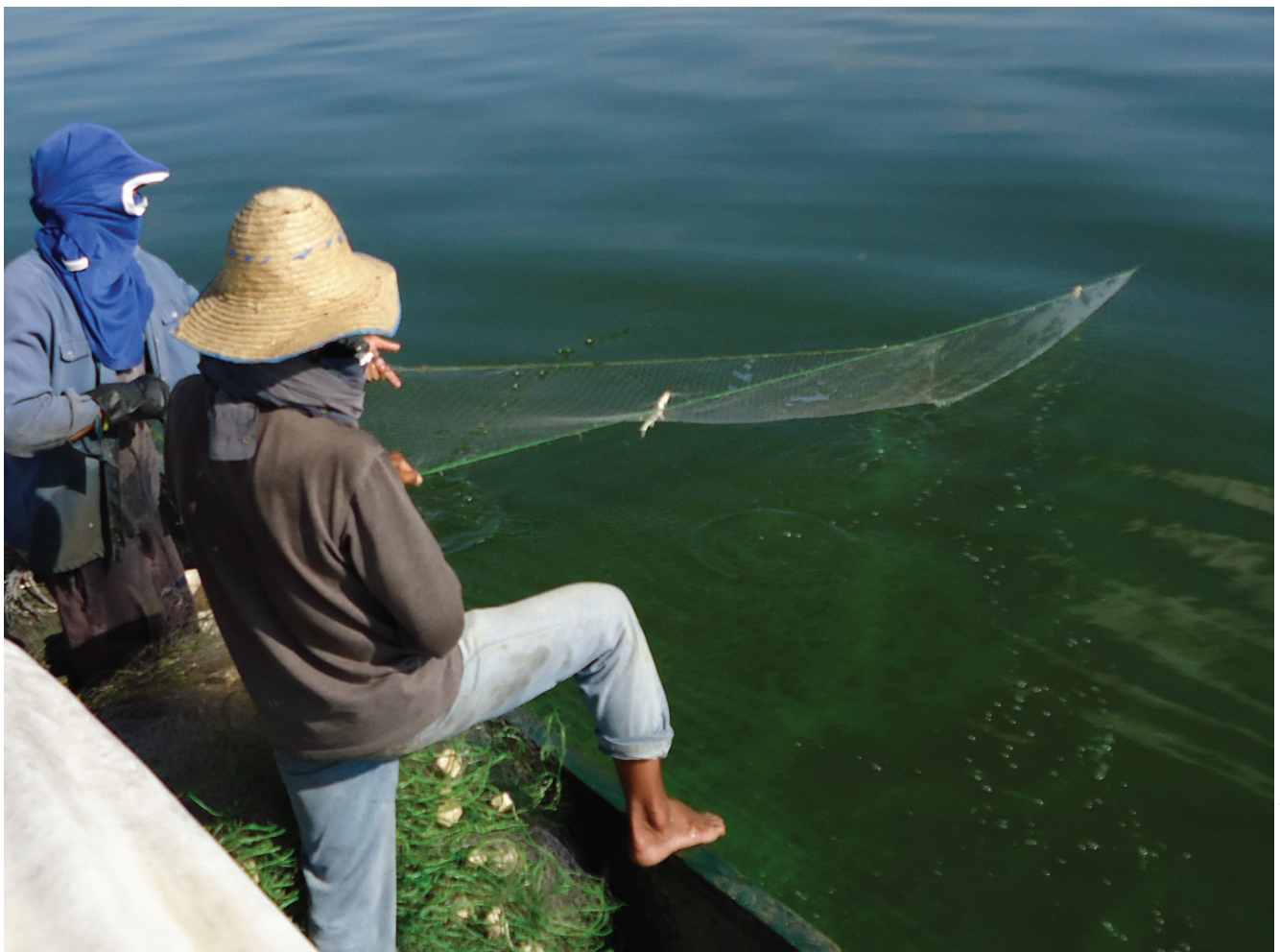
Ciénaga de Zapatoza