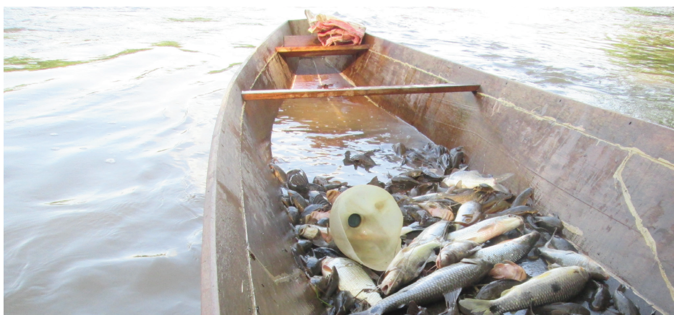
Fotografía: Jhonk Zambrano / Neiva, Huila