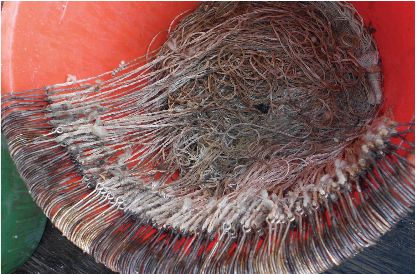
Fotografía: Socorro Sánchez Fajardo / Chinchagua, Cesar